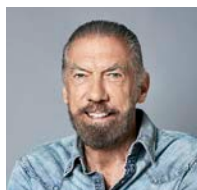
John Paul DeJoria